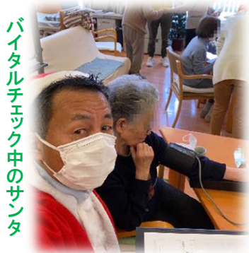
バイタルチェック中のサンタ