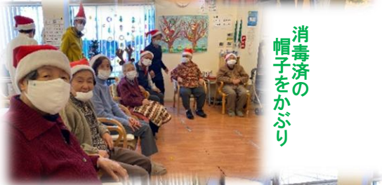
消毒済の 帽子をかぶり

「2022年」新しい年を迎えました。 本年もよろしくお願いいたします。 コロナ コロナで明け暮れて。なおさら月日の過ぎ て行くのが早く感じられる昨今ですが… 年末のフラワーアレンジからクリスマスからお正月 まで、ほんの10日間の出来事です。今年も 写真や記事でデイサービス・エプロンの様子をお伝 えさせていただきます。オミクロンなんぞに負けないよ う、御身(オミ=オンミ)大切に！！