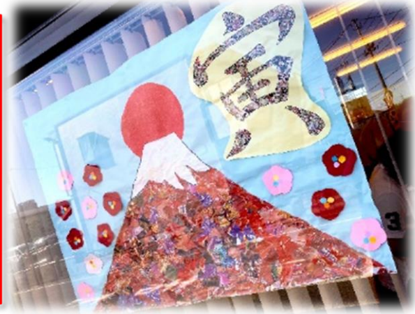
ちぎり絵による「赤富士&干支」寅

「2022年」新しい年を迎えました。 本年もよろしくお願いいたします。 コロナ コロナで明け暮れて。なおさら月日の過ぎ て行くのが早く感じられる昨今ですが… 年末のフラワーアレンジからクリスマスからお正月 まで、ほんの10日間の出来事です。今年も 写真や記事でデイサービス・エプロンの様子をお伝 えさせていただきます。オミクロンなんぞに負けないよ う、御身(オミ=オンミ)大切に！！