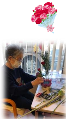
年末のフラワーアレンジはこんな感じでした。