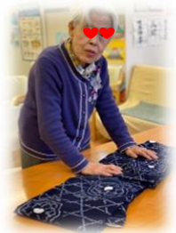
浴衣を上手に畳 んで下さいました。 さすがです！