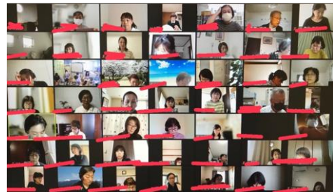
Zoomの画面いっぱいのメンバーたち

2022年度、感染予防の不安から中止していたエプロンまつりも再開したいと考えています。規模は小さくても、できることからやっと思っています。